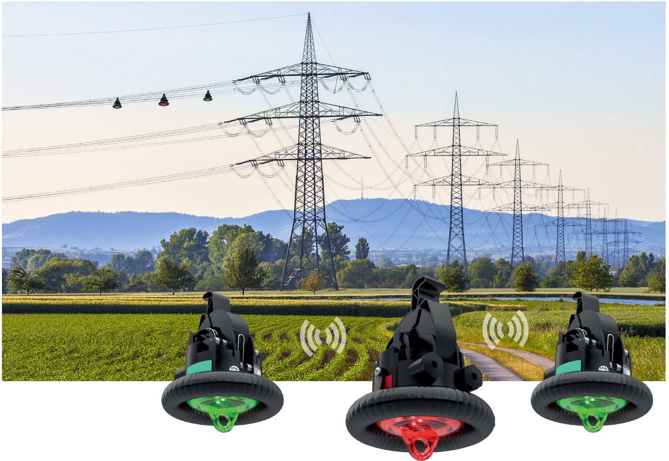
Smart Navigator 2.0 HV