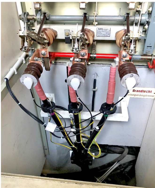
Nachgerüstete Strom- und Spannungssensoren zur Lastfluss-erkennung je Abgang.